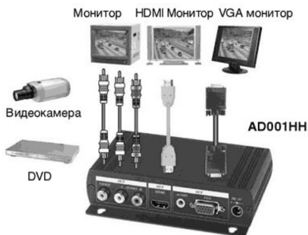
Рис.2 Схема подключения AD001HH