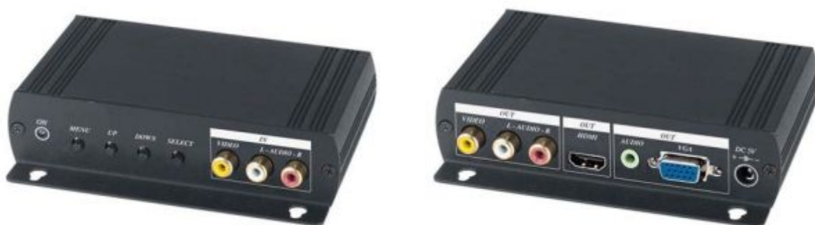
Рис.1 Внешний вид AD001HH