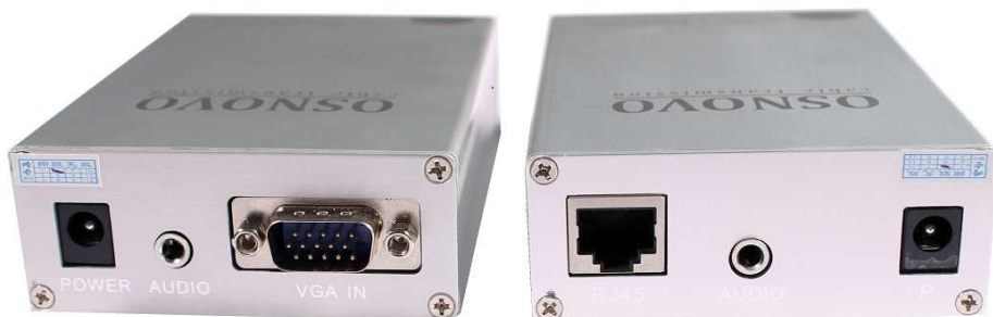
Рис.1 Внешний вид TA-U1+RA-U1