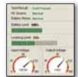
ПО Power Management