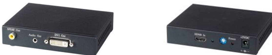
Рис.1 Внешний вид HD01