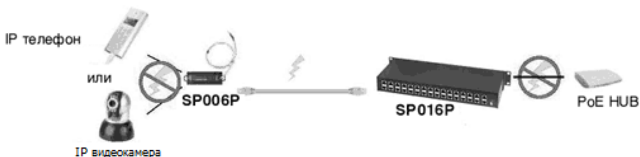
Рис.3 Подключение SP016P .