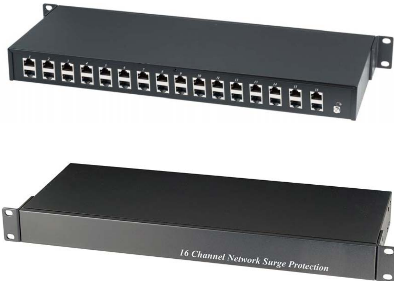
Рис.1 Внешний вид SP016P / SP016N .