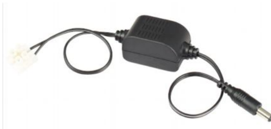
Рис.1 Внешний вид PC500