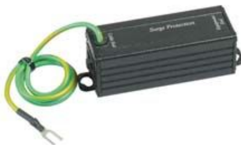
Рис.1 Внешний вид