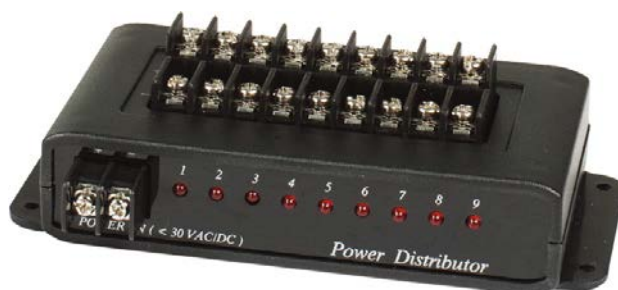
Рис. 1 Лицевая панель блока питания PD009