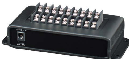
Рис. 2 Задняя панель блока питания PD009