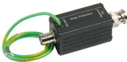
Рис.1 Внешний вид SP009