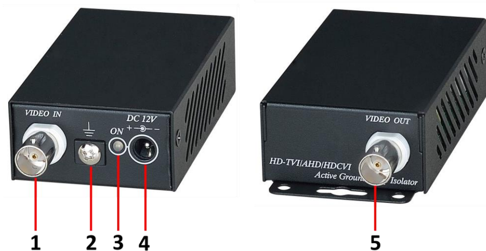
Рис. 2 Изолятор GL001HD, разъемы и LED-индикаторы передней и задней панелей