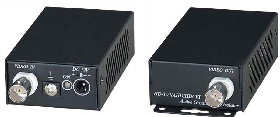
Рис.1 Изолятор GL001HD, внешний вид спереди/сзади