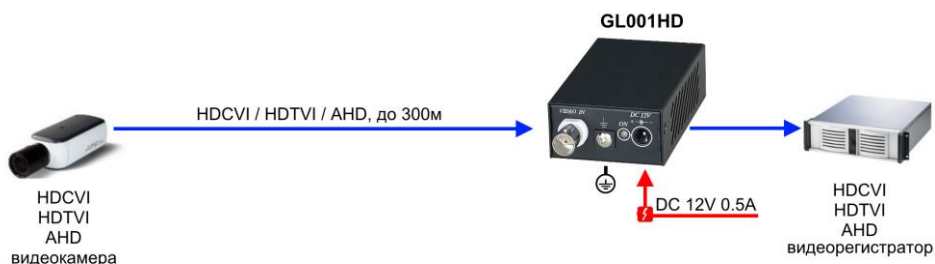
Рис.4 Изолятор GL001HD, типовая схема подключения