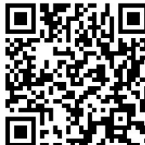
Прошивки и утилиты